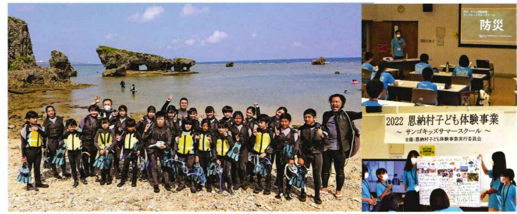
これからも谷茶の丘、雅は様々な分野の方々と「繋がり」ながら、地域貢献に取り組みます。

夏休み期間中の7月26日、27日、29日の3日間、恩納村子ども体験事業「サンゴキッズサマースクール」が開催されました。 開催の目的は、 ①子供たちに自然のなかで体験をする機会を設け、力強く生き抜く力を育み、地域に貢献できる人材を育成すること ②地域の子どもリーダーとなっていく人材を育て、防災ボランティア、海の環境などにも寄与できる子供たちの健全育成を目指すことです。 「恩納村社会福祉協議会、NPO法人ユナイテッドかながわ、一般社団法人やまと災害ボランティアネットワーク」に置かれた事務局のもとで、恩納村役場、恩納村観光協会、商工会等11の団体・事業所で実行委員会が組織され、谷茶の丘、雅もこの一員として参加しました。 当日は村内の小中学生22名が参加し、1日目は「防災」、2日目は「海の環境」について学び、3日目は恩納村長をはじめ実行委員の皆さんの前で「報告会」がおこなわれました。今回村内の行政と多業種が連携して子どもたちの育成の取り組みが行えたことは素晴らしいことだと思えます。